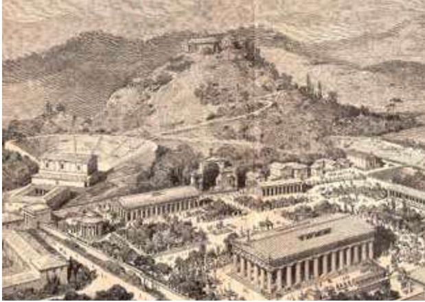
De oude Olympische Spelen waren een dorp in de heuvels.