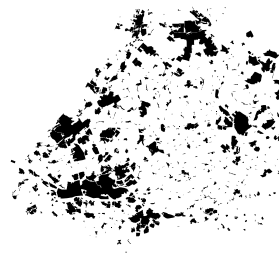
Randstad 7.2 miljoen inwoners

Nederland met zijn vele rivieren en vruchtbare bodem is altijd een land geweest dat het van slimme landbouw en veeteelt en van handel en logistiek moest hebben. Weinig ruimte, maar slim gebruikt, veel verbindingen, en een rijkgeschakeerd en goed georganiseerd stedelijk leven. Dat was in de middeleeuwen zo, in de Gouden Eeuw, in de industriële hoogtijdagen en het is nog altijd zo. In de geglobaliseerde economie van vandaag is Nederland vooral een draaischijf, een hub voor het verkeer van kennis, mensen en goederen. En de Randstad is een heel karakteristiek stedelijk netwerk dat het leven en werken in die wereld-hub mogelijk maakt. Ons vernuft, onze manier van leven, onze culturele identiteit zijn eraan af te lezen. Als je ervoor wilt zorgen dat de Olympische Spelen ook werkelijk voor iedereen 'olympisch' zijn, en niet alleen